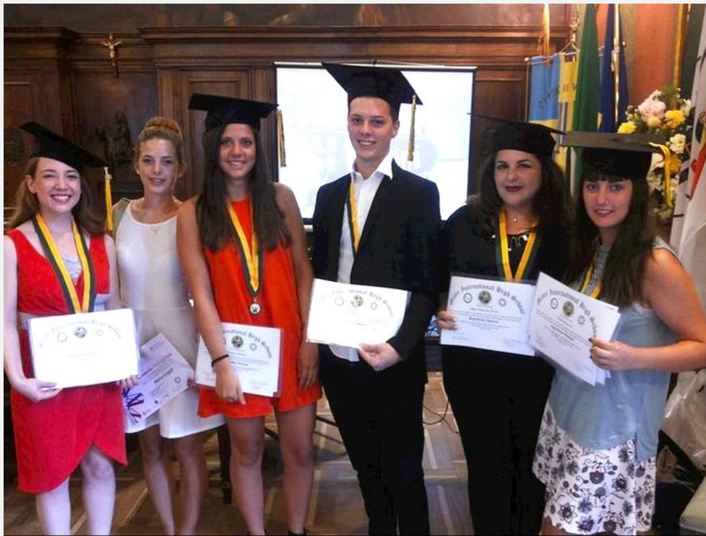
Premiers élèves diplômés en Italie